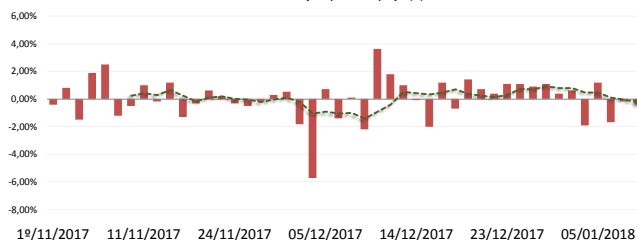
Petrobras | Ajustes nos preços da Gasolina

desde a mudança na política de preços (%)